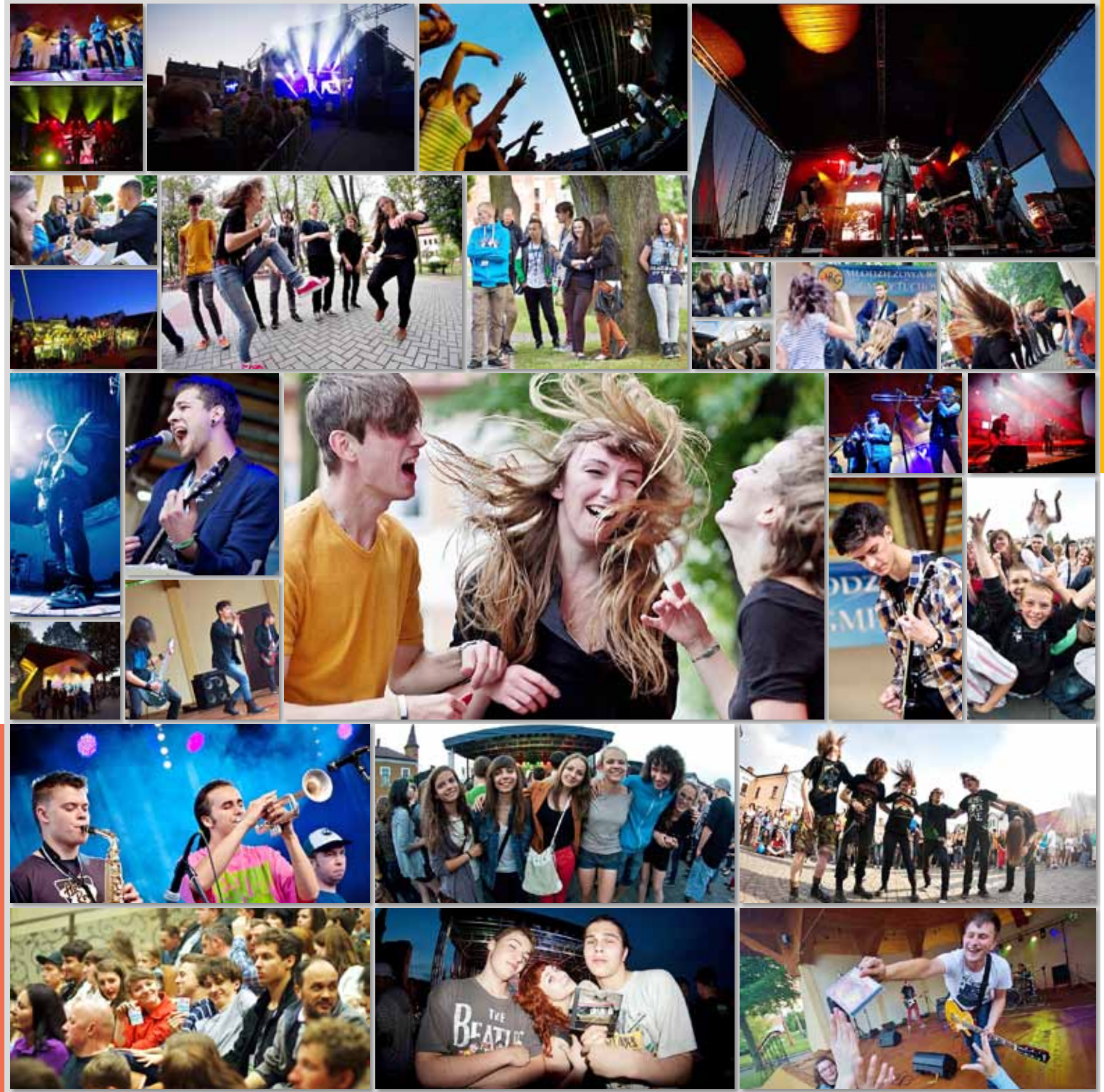
- Muzyka, imprezy i koncerty |