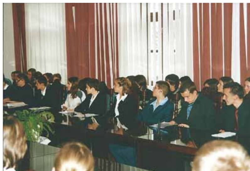
Archiwum M. Dulian, na zdjęciu młodzież podczas nieformalnej sesji w tuchowskim ratuszu