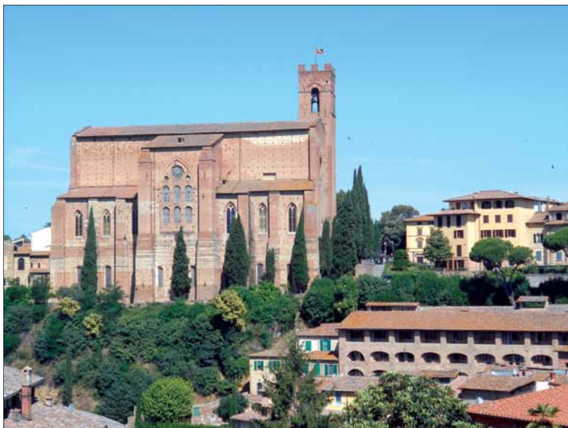
Bazylika San Domenico w Sienie.