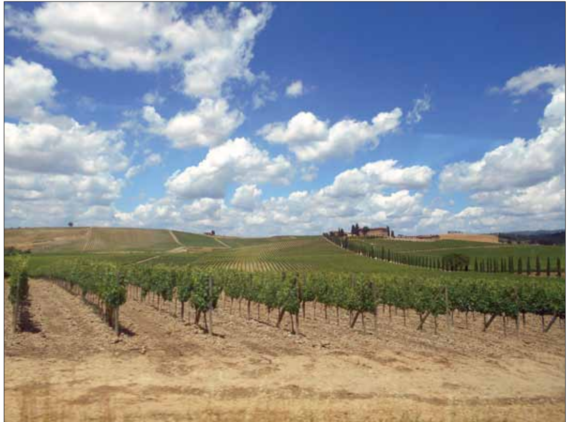
Typowy toskański krajobraz: winnice, aleje cyprysowe, wille na wzgórzach ...

Ostatni dzień spędzamy we Florencji, mieście malarzy i archi-