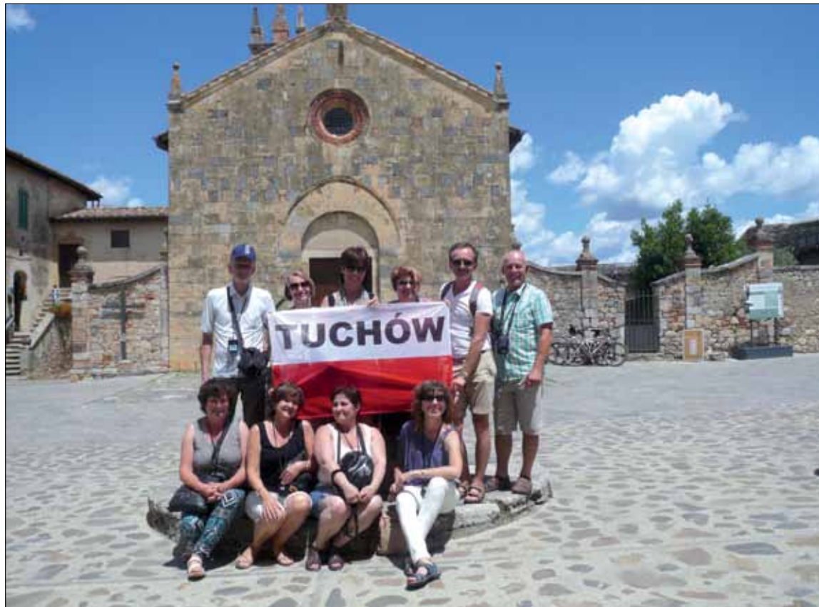
W Monteriggioni - Piekło „Boskiej komedii” Dantego Alighieri.

Nareszcie jesteśmy na miejscu. Naszą włoską przygodę rozpoczynamy od zwiedzania Sieny, miasta, które od zawsze rywalizowało z Florencją o względy turystów i miano najpiękniejszego w Toskanii! Przed nami w blasku porannego słońca rysują się okazałe budowle: Katedra w Sienie i Bazylika San Domenico. Sienieńska katedra z koronkową fasadą ozdobiona dziesiątkami posągów i wieżyczek jest dumą mieszkańców. Jej budowę rozpoczęto w XII w. i kiedy w 1264 r. wydawało się, że budowa katedry zakończyła się, niepokojące wieści przysły z Florencji, gdzie rozpoczęto budowę znacznie większej katedry. A że, jak już wcześniej wspomniałam, te dwa miasta rywalizowały ze sobą, Siena nie dała za wygraną i postanowiła, że wzniesiona dotąd bazylika o długości 90 m będzie jedynie nawą poprzeczną nowego gigantycznego kościoła. Niestety śmiałe plany nie zostały zrealizowane z powodu braku pieniędzy na dalszą budowę, a śladem tego ambitnego zamierzenia są nieukończone filary i mury tworzące niezwykle kulisy placu katedralnego przy bocznej elewacji. Największym po katedrze kościołem Sieny jest San Domenico. Świątynia Dominikanów przez swoją surową bryłę należy do najbardziej charakterystycznych elementów miasta. W bazylice jest kaplica św. Katarzyny, gdzie przechowuje się czaszkę świętej (grób jest w Rzymie). Można spotkać tu także polski element. Na lewej ścianie znajduje się obraz przedstawiający pierwszego polskiego dominikanina, św. Jacka Odrowąża. Aby poczuć specyficzny klimat Sieny należa-