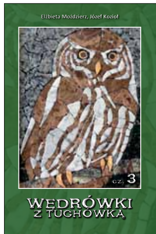
WĘDRÓWKI Z TUCHÓWKĄ

Realizacja operacji pt.: Kompleksowe opracowanie i wydanie publikacji promujących gminę Tuchów, której celem jest rozwijanie turystyki oraz promocja lokalnego dziedzictwa kulturowego, historycznego i przyrodniczego poprzez kompleksowe opracowanie i wydanie publikacji promujących gminę Tuchów.