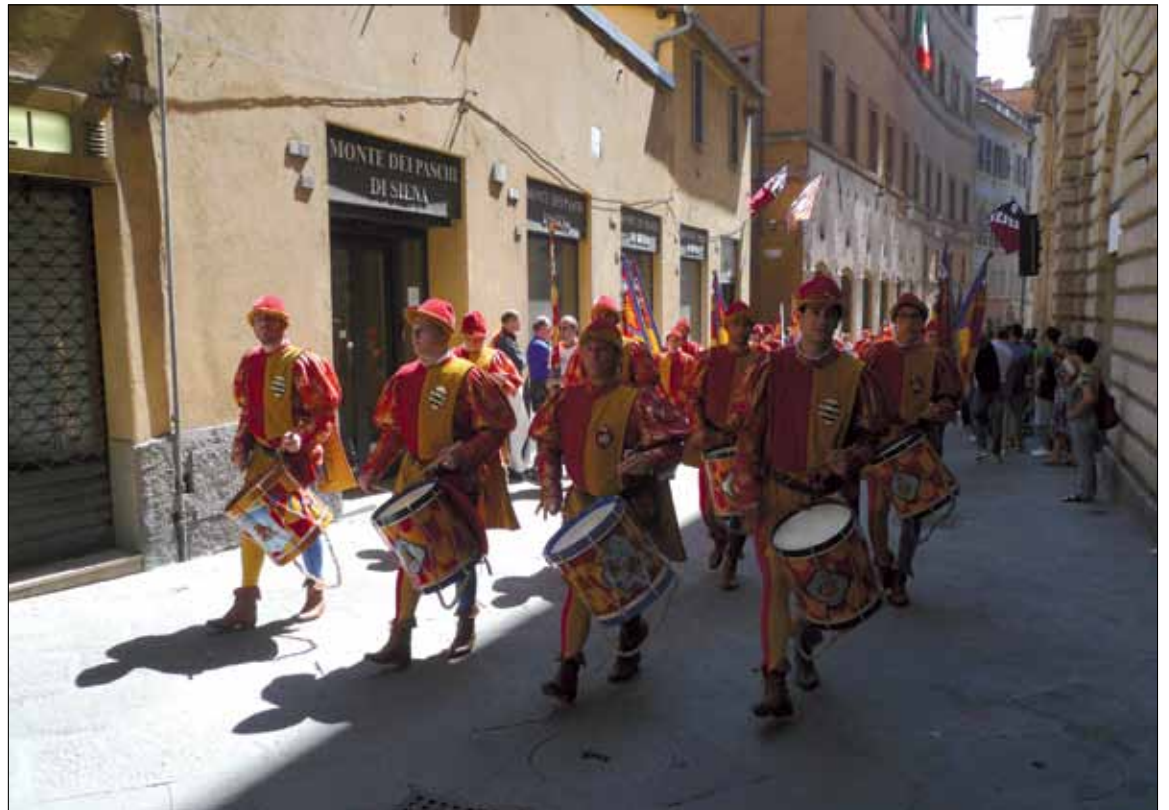
Sieneńscy bębniarze na ulicach miasta.

tektów, poetów i humanistów, bankierów i książąt, kolebce renesansu. Spotykamy się z panią przewodnik, która oprowadza nas po niezwykłych miejscach Florencji. Jesteśmy na Piazza del Duomo, w centrum ogromnego placu, na którym znajduje się katedra niemal w całości zajmująca plac. Tuż obok znajduje się 85-metrowa dzwonnica i baptysterium. Katedra Santa Maria del Fiore - Katedra Matki Boskiej Kwietnej jest symbolem Florencji i przedmiotem największej dumy florentyńczyków. Zwieńczeniem katedry jest gigantyczna kopuła górująca nad czerwonymi dachami miasta, dzieła Brunelleschiego, który po tym dziele został obwołany nowym Ikarem.. Na uwagę zasługuje również Bazylika Santa Croce, drugi co do wielkości kościół Florencji. Jest najważniejszą nekropolią sławnych obywateli miasta. Przed wejściem stoi pomnik Dantego, nagrobek Michała Anioła znajduje się w prawej nawie, kawałek dalej nagrobek słynnego myśliciela Machiavellego, dalej nagrobek Galileusza.... Oczywiście to nie wszystko, czym można się zachwycić we Florencji! Ale