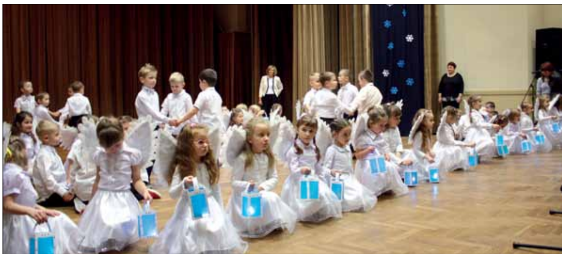
Występ dzieci z Przedszkola Publicznego w Tuchowie