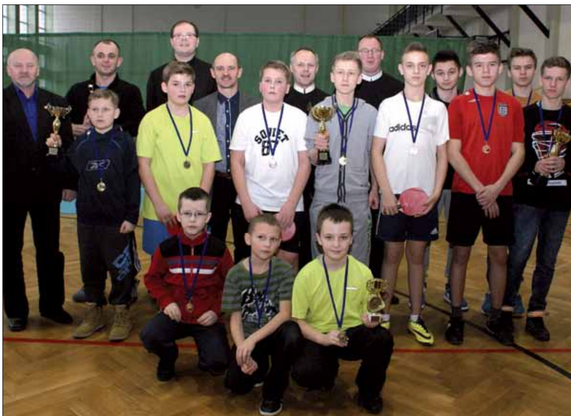
Najlepsi w turnieju tenisa stołowego