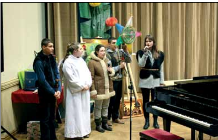
Kolędnicy z Kielanowic