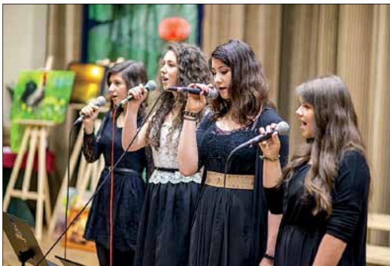
Zespół wokalny „ATRIA”