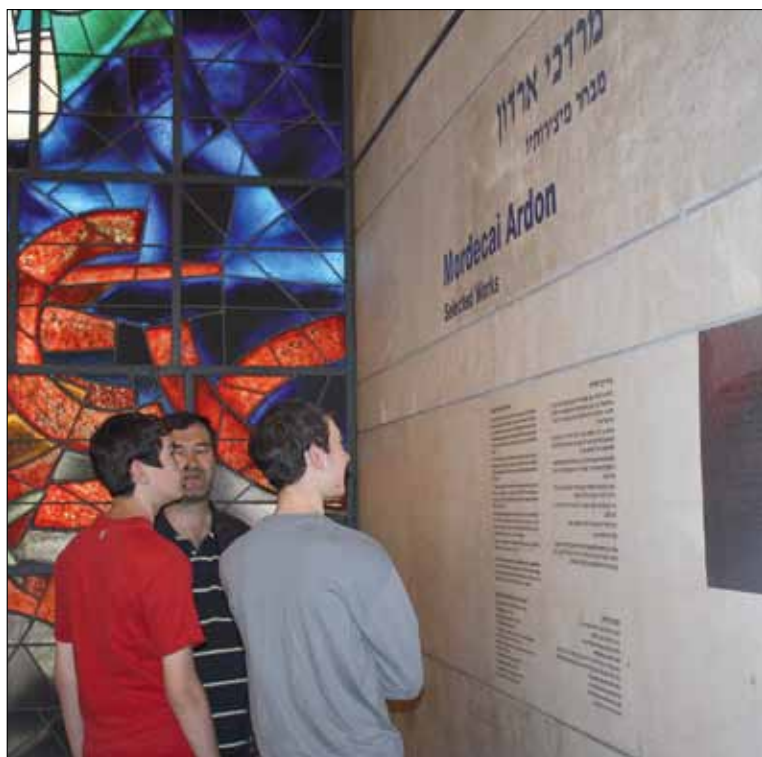
Przed biografią Mordechaja Ardon