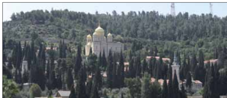
Ein Karem – widok na Sanktuarium Nawiedzenia Świętej Elżbiety i Monastyr Gorniński

zmiana charakteru Bezalel School of Art and Crafts, której Ardon był rektorem. Czyby idee Bauhausu zostały przeniesione na izraelski grunt?