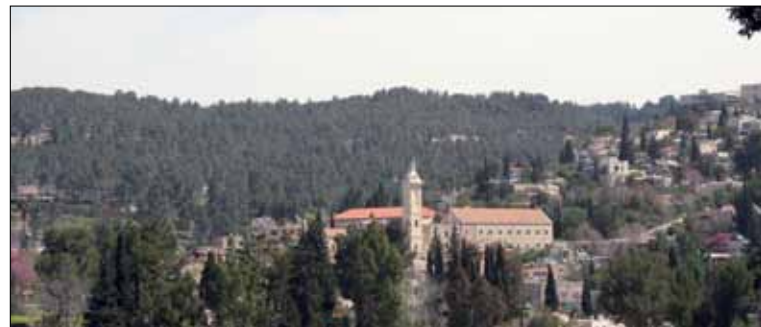
Ein Karem – widok na kościół św. Jana Chrzciciela

Znawcy sztuki twierdzą, że zasługą naszego artysty jest