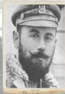
Mjr Edward Rydz Śmigły 1886 - 1941 Dowódca 1. Pułku Piechoty I Brygady Legionów Polskich w bitwie pod Łowczówkiem