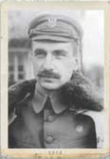
Płk Kazimierz Sosnkowski 1885 - 1969 Dowódca I Brygady Legionów Polskich w bitwie pod Łowczówkiem