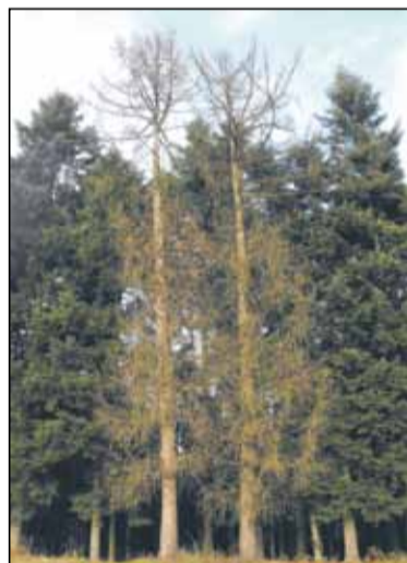
Modrzew ( Larix )