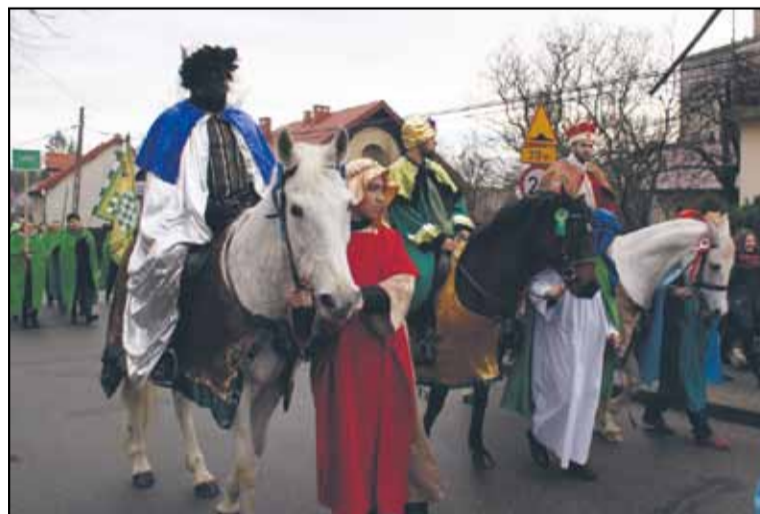
Królowie, przemierzając kolejne krainy, widzieli różne dziwne m.in. walkę dobra ze złem. W swym sercu odczuwali ową walkę, ale pomimo pokus i zmęczenia wyruszyli na kolejny etap wędrówki, i jak się potem okazało, już niezwykle krótki.

Tymczasem w ubogiej szopie w Betlejem Maryja z Józefem znaleźli miejsce na spoczynek i tam narodził się ich syn Jezus.