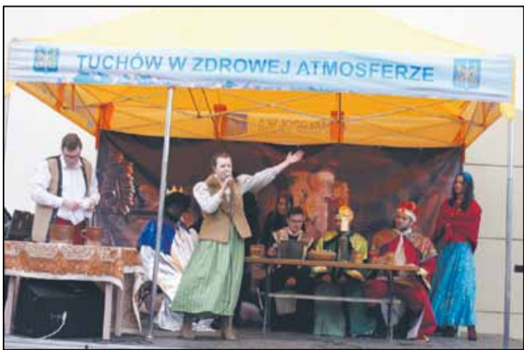
W gospodzie trwała zabawa, goście pili, jedli i dobrze się bawili... lecz wkrótce zrozumieli, że w niedalekim Betlejem narodziło się Dziecię, które ma ten świat zbawić i życie szczęśliwym uczynić.

Królowie, idąc za gwiazdą do Betlejem, zatrzymali się na posiłek w karczmie.