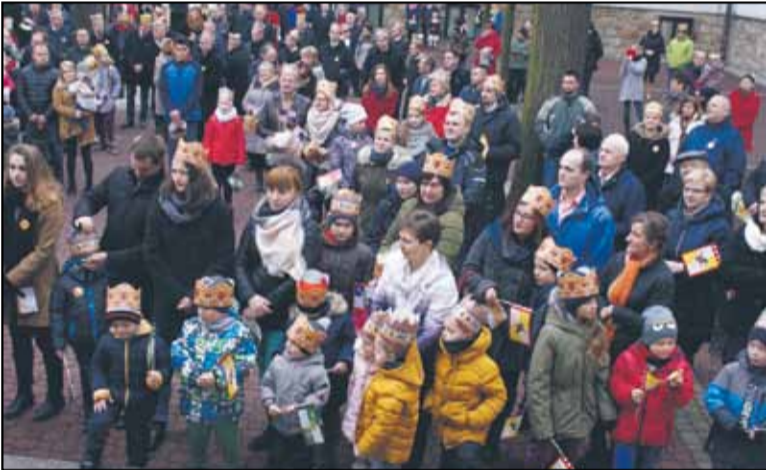
O godz. 11.15 uczestnicy orszaku licznie zgromadzili się na dziedzińcu klasztornym przed kaplicą połową (młodzież z KSM-u rozdawała korony, śpiewniki, chorągiewki i orszakowe naklejki).