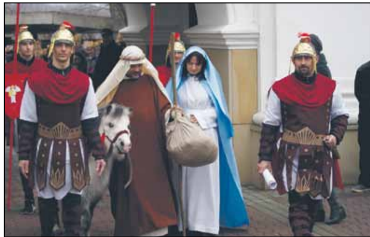
W drogę Maryjo, Betlejem czeka, Bóg do każdego chce przyjść człowieka. Udał się więc Józef z Galilei, z miasta Nazaret do Judei, do miasta Dawidowego, zwanego Betlejem, ponieważ pochodził z domu i rodu Dawida, żeby się dać zapisać z poślubioną sobie Maryją, która była brzemienna. Wczuwamy się w ich sytuację, przed nimi długa i wyczerpująca droga.