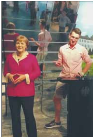
W Muzeum Figur Woskowych Madame Tussauds w Berlinie