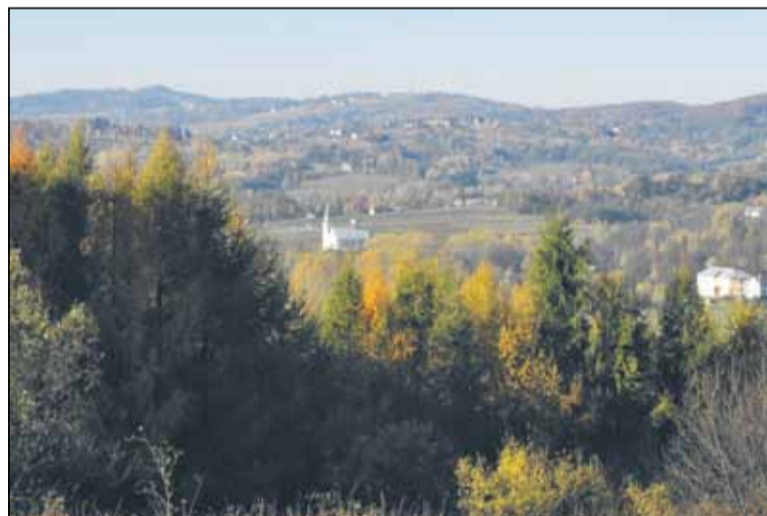
Las modrzewiowy jesienią

ładne, karminowo-czerwone, potem brązowe, a w końcu szare. Dojrzewają na przełomie października i listopada. Rozchylają się łuski, wysypują nasiona, ale szyszki pozostają na drzewie jeszcze od jednego roku do kilku lat.