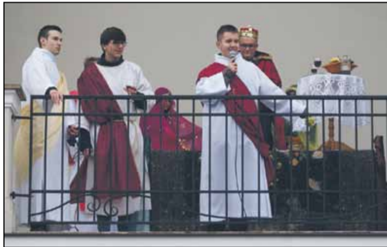
Przenosimy się do Jerozolimy przed pałac Heroda skąd słyhać śpiew, muzykę i tańce, gdzie bogactwo i rozpusta królują i zaślepiają oczy tam żyjących.