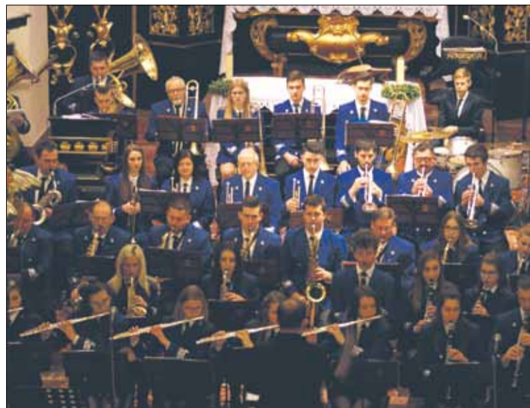
FOT. KRZYSZTOF JASŃSKI