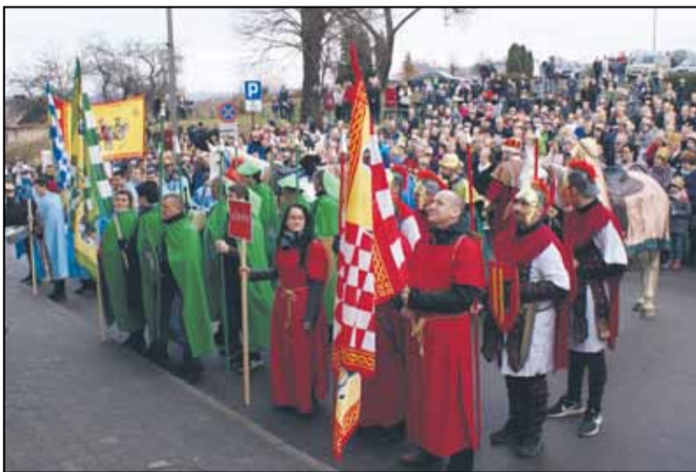
Mędrców trzech przybyło z dala, głosząc śmiało, że ich celem znalezienie prawdziwego, w szopie narodzonego Króla Rodu Żydowskiego!

Trzej Królowie po spotkaniu z Herodem wraz ze swoimi orszakami wyruszyli za gwiazdą, która wskazywała im drogę do Betlejem.