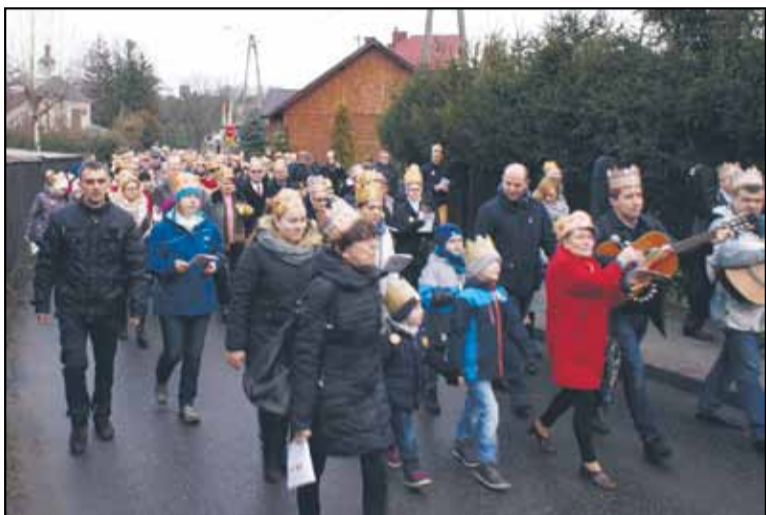
Ze śpiewem na ustach, z towarzyszeniem zespołu „Pokolenia” oraz grupy kołędniczej z Kielanowic orszak przeszedł ulicami miasta.