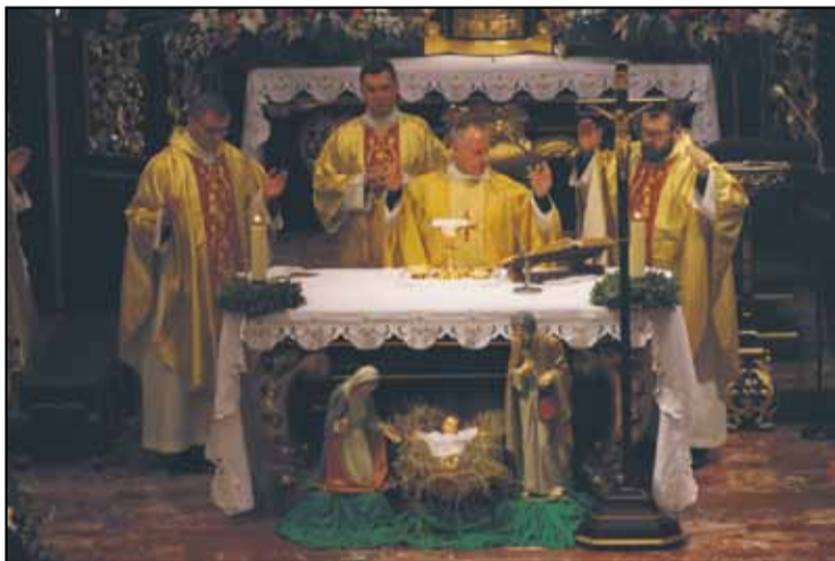
O godz. 10.30 odprawiona została uroczysta msza św. w bazylice mniejszej w Tuchowie.

6 stycznia 2018 roku ulicami 644 miejscowości w Polsce przeszedł 10. Orszak Trzech Króli. W drogę do Betlejem udało się ponad 1,2 mln uczestników! Papież Franciszek wspominał o orszaku po modlitwie „Anioł Pański”, a Para Prezydencka wzięła udział w orszaku w Skoczowie. Cieszymy się, że również Tuchów znalazł się na orszakowej mapie miejscowości, w których orszaki są organizowane. Był wydarzeniem religijnym o charakterze edukacyjno-kulturalnym, z zachowaniem tradycji i prawd wiary katolickiej, promującym wartości kultury narodowej i chrześcijańskiej. Hasło tegorocznego orszaku brzmiało: „Bóg jest dla wszystkich”. Zobaczmy jak było, przeżyjmy to jeszcze raz!