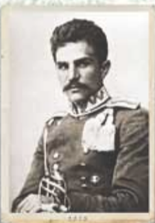
Rtm. Władysław Prażmowski Belina 1888 - 1938 Twórca i dowódca kawalerii I Brygady Legionów Polskich