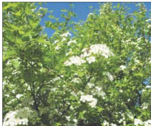
Kwiaty głogu z bliska