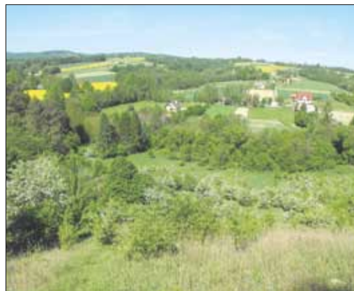
Dolina Mesznianki – kwitnące krzewy głogów

Gdzie znajdziemy najpiękniejszą różę w Tuchowie?