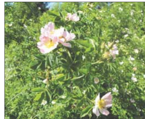
Kwitnący krzew dzikiej róży

Róża dzika posiada silny, zdrewniały, rozgałęziony korzeń, który dobrze utrwała podłoże (ważna cecha na skarpach). Jest odporna na mrozy. Należy do roślin leczniczych. Surowcem lekarskim są owoce, rzadziej – płatki kwiatów. Owoce róży zbiera się ręcznie, w miarę dojrzewania, gdy są już wybarwione, ale jeszcze twarde. Trwa to od sierpnia do października, przed nadejściem przymrozków (tracą wtedy witaminę C). Owoce róży zawierają bardzo dużo witaminy C (20-30 razy więcej niż cytryna). Trzy owoce róży pokrywają w zupełności codzienne zapotrzebowanie organizmu