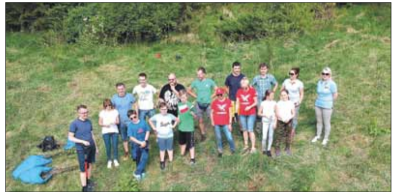
Sadzenie drzewek w Jodłówce Tuchowskiej

który uległ wypadkowi samochodowemu i wymaga rehabilitacji.