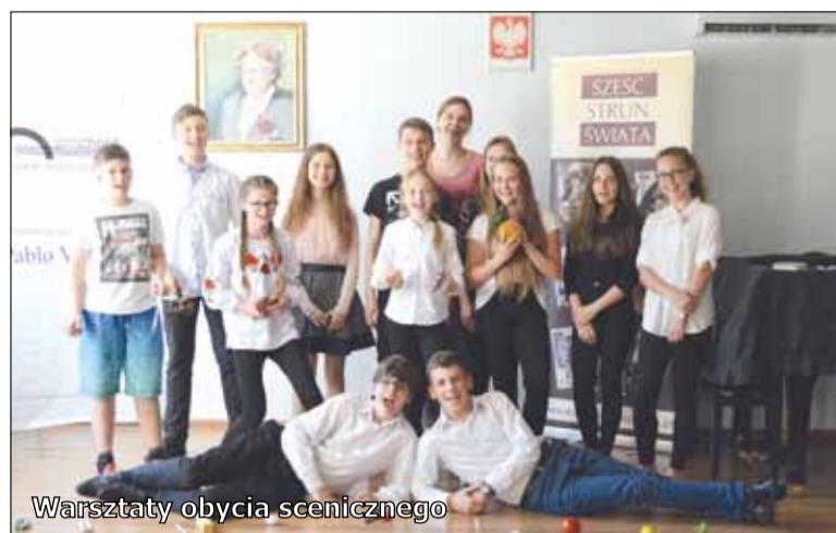
Warsztaty obycia scenicznego