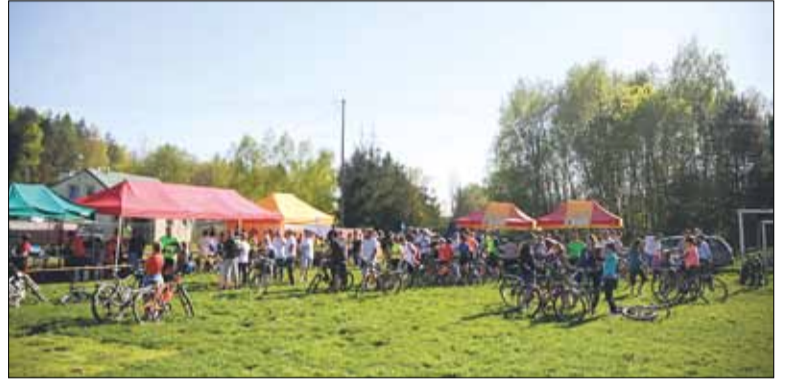
Charytatywny Rajd Rowerowy przez Karwodrę