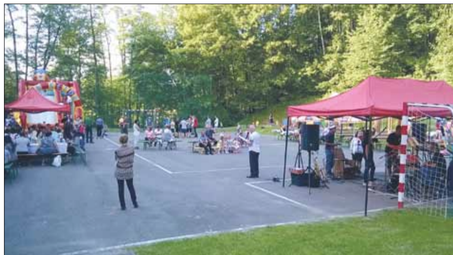
Festyn w Trzemesnej