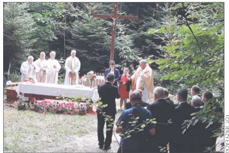
Msza polowa w Trzemeskim Lesie

kolejny cmentarz choleryczny. Ostęp leśny zwany „Czerwonym Dołem” położony na Galii kryje wspomniane mogiły ofiar zarazy z Karwodrzy