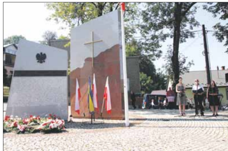
FOT. WOJCIECH KRAS